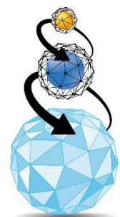
Triple Layer Technology Tecnologia a Triplo Strato

IMPERIAL FOOD gebruikt een unieke productietechniek, die het mogelijk maakt om de voordelen van de twee meestgebruikte productietechnieken van hondenvoer te combineren. De speciale Triple Layer Technology is het resultaat van een technisch proces, geïntroduceerd door IMPERIALFOOD S.R.L. in 1987. Deze techniek bestaat uit twee fasen: allereerst het koken en extruderen van de geselecteerde ingrediënten, waarna in de tweede koude fase de essentiële voedingselementen toegevoegd worden. Hierdoor komende goede eigenschappen van het warme en koude proces samen.