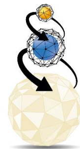
Triple Layer Technology Tecnologia a Triplo Strato

ImperialFood maakt gebruik van een unieke productietechniek, die het mogelijk maakt om de voordelen van de twee meestgebruikte productietechnieken van hondenvoer te combineren. De speciale Triple Layer Technology is het resultaat van een technisch proces, geïntroduceerd door IMPERIALFOOD S.R.L. in 1987. Deze techniek bestaat uit twee fasen: allereerst het koken en extruderen van de geselecteerde ingrediënten, waarna in de tweede koude fase de essentiële voedingselementen toegevoegd worden. Hierdoor komende goede eigenschappen van het warme en koude proces samen.