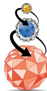
Triple Layer Technology Tecnologia a Triplo Strato

ImperialFood maakt gebruik van een unieke productietechniek, die het mogelijk maakt om de voordelen van de twee meestgebruikte productietechnieken van hondenvoer te combineren. De speciale Triple Layer Technology is het resultaat van een technisch proces, geïntroduceerd door IMPERIALFOOD S.R.L. in 1987. Deze techniek bestaat uit twee fasen: allereerst het koken en extruderen van de geselecteerde ingrediënten, waarna in de tweede koude fase de essentiële voedingselementen toegevoegd worden. Hierdoor komende goede eigenschappen van het warme en koude proces samen.