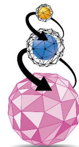
Triple Layer Technology Tecnologia a Triplo Strato

ImperialFood maakt gebruik van een unieke productietechniek, die het mogelijk maakt om de voordelen van de twee meestgebruikte productietechnieken van hondenvoer te combineren. De speciale Triple Layer Technology is het resultaat van een technisch proces, geïntroduceerd door IMPERIALFOOD S.R.L. in 1987. Deze techniek bestaat uit twee fasen: allereerst het koken en extruderen van de geselecteerde ingrediënten, waarna in de tweede koude fase de essentiële voedingselementen toegevoegd worden. Hierdoor komende goede eigenschappen van het warme en koude proces samen.