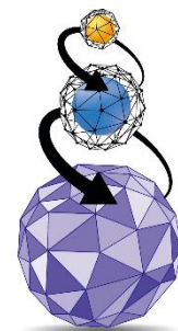
Triple Layer Technology Tecnologia a Triplo Strato

ImperialFood maakt gebruik van een unieke productietechniek, die het mogelijk maakt om de voordelen van de twee meestgebruikte productietechnieken van hondenvoer te combineren. De speciale Triple Layer Technology is het resultaat van een technisch proces, geïntroduceerd door IMPERIALFOOD S.R.L. in 1987. Deze techniek bestaat uit twee fasen: allereerst het koken en extruderen van de geselecteerde ingrediënten, waarna in de tweede koude fase de essentiële voedingselementen toegevoegd worden. Hierdoor komende goede eigenschappen van het warme en koude proces samen.