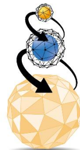
Triple Layer Technology Tecnologia a Triplo Strato

ImperialFood maakt gebruik van een unieke productietechniek, die het mogelijk maakt om de voordelen van de twee meestgebruikte productietechnieken van hondenvoer te combineren. De speciale Triple Layer Technology is het resultaat van een technisch proces, geïntroduceerd door IMPERIALFOOD S.R.L. in 1987. Deze techniek bestaat uit twee fasen: allereerst het koken en extruderen van de geselecteerde ingrediënten, waarna in de tweede koude fase de essentiële voedingselementen toegevoegd worden. Hierdoor komende goede eigenschappen van het warme en koude proces samen.